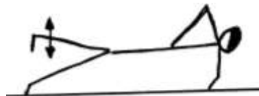
stabilizacja x 10 (unoszenie N)