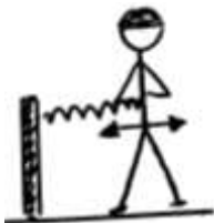
FH/BH 10(sek) / 10