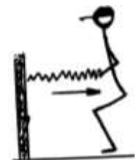
mm. grzbietu 10(sek) / 10